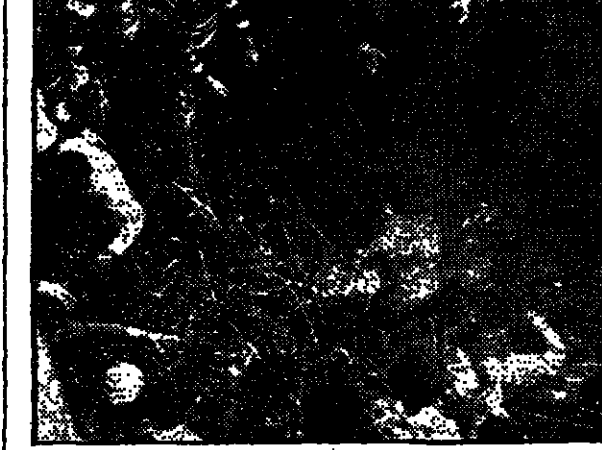
החוקר המפיק שורף את גופת המהומה

היחידה הישראלית שהתפרקה לאחר הטבח בירושלים, עזבה את השטח לאחר שהשלמת פעולת החילוץ. היחידה הישראלית שהתפרקה לאחר הטבח בירושלים, עזבה את השטח לאחר שהשלמת פעולת החילוץ. היחידה הישראלית שהתפרקה לאחר הטבח בירושלים, עזבה את השטח לאחר שהשלמת פעולת החילוץ. היחידה הישראלית שהתפרקה לאחר הטבח בירושלים, עזבה את השטח לאחר שהשלמת פעולת החילוץ. היחידה הישראלית שהתפרקה לאחר הטבח בירושלים, עזבה את השטח לאחר שהשלמת פעולת החילוץ. היחידה הישראלית שהתפרקה לאחר הטבח בירושלים, עזבה את השטח לאחר שהשלמת פעולת החילוץ.